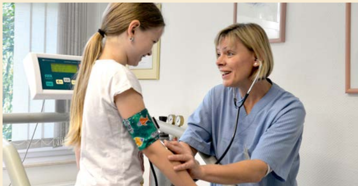
Pflegerische und medizinisch-kardiologische Kompetenz vor Ort...

In besonderen Situationen kann eine intensivere Behandlung in dem ortsnahen Herzzentrum erfolgen.