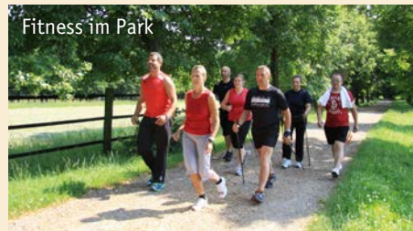
Fitness im Park