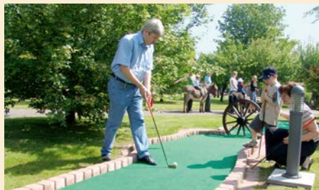
Entspannung für die ganze Familie