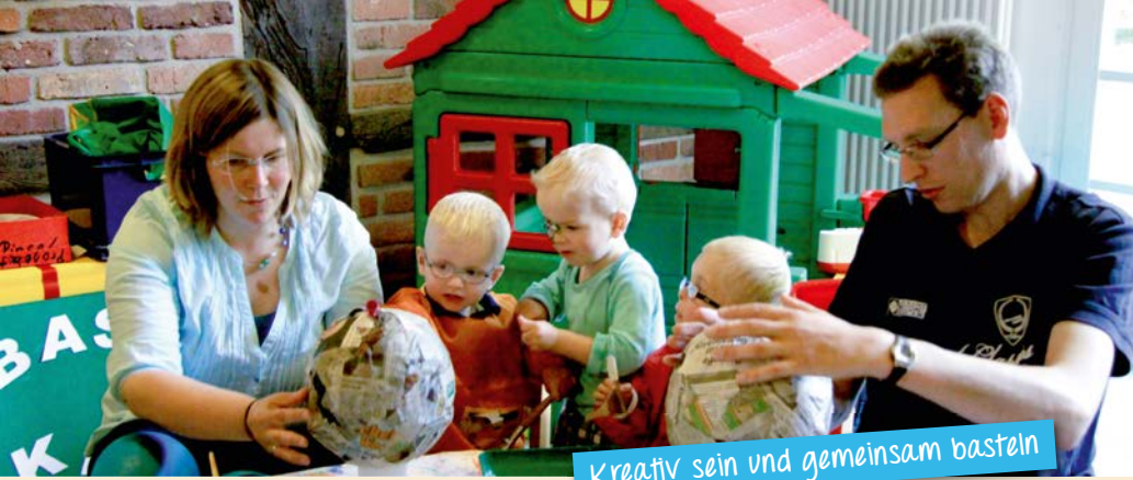
Kreativ sein und gemeinsam basteln