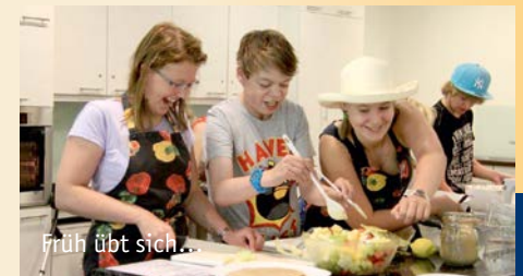
Früh übt sich...