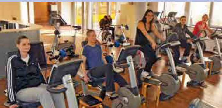
Mit Sporttherapie wieder Leistungsfähig werden

Das Rehateam der Klinik Bad Oexen besteht aus Fachkräften der verschiedensten Bereiche (u.a. Fachärzte für Gynäkologie, Diplom-Psychologen (u.a. mit Schwerpunkt Psychosoziale Onkologie) Lymph-, Physio- und Sporttherapeuten, Pflegefachkräften (z.B. Stoma- und Kontinenzberatung, Wundmanagement, Pelvic Care) Ernährungstherapeutinnen, Sozialarbeitern und verfügt aufgrund entsprechender Fallzahlen und langjähriger Erfahrung über ein umfangreiches Wissen bei der Behandlung von therapiebedingten Störungen.