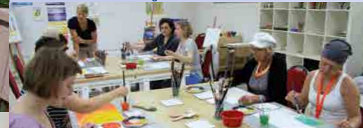
Entspannung in der Kunsttherapie