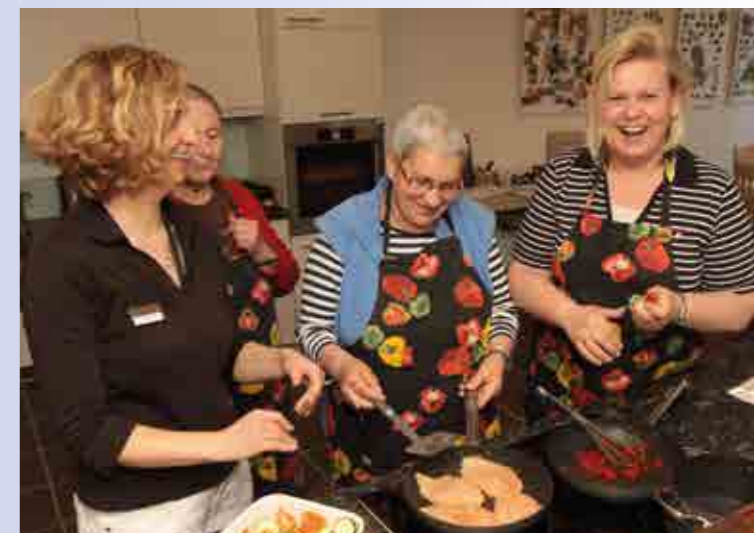
In der Lehrküche mit Spaß gesunde Ernährung erfahren

Für Patientinnen mit Vulvakrebs, die zusätzlich Kolostoma, Ileostoma oder Urostoma haben und inkontinent sind, besteht die Möglichkeit, sich im Hinblick auf die Hilfsmittelversorgung beraten zu lassen. Die Versorgung mit Hilfsmitteln (Beutelsysteme, Vorlagen etc.) erfolgt durch die Klinik Bad Oexen.