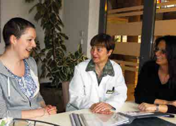
Wohltuende Gespräche unter ärztlicher Begleitung